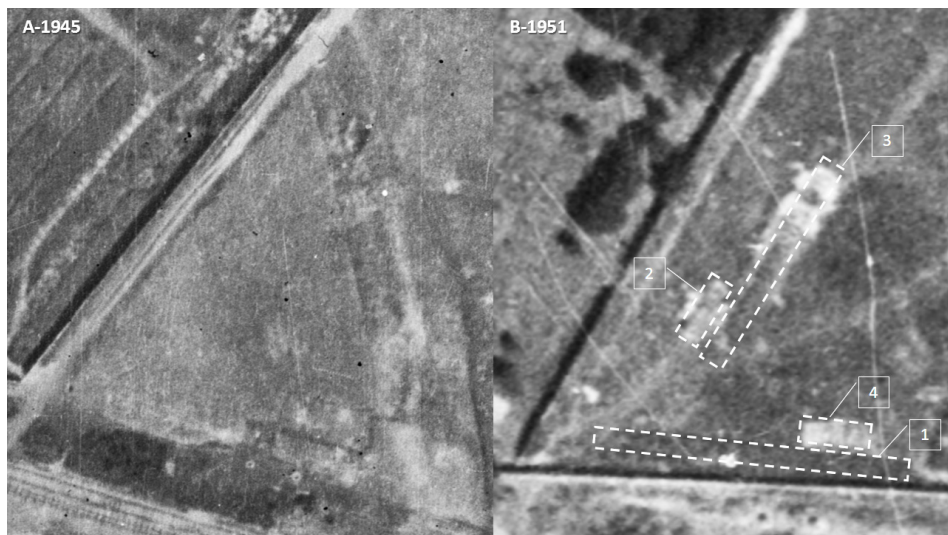
1. Fotografie lotnicze przedstawiające kwaterę „L” Cmentarza Wojskowego przy ul. Powązkowskiej w Warszawie w 1945 (A-1945) i 1951 r. (B-1951). Oznaczono i opisano tylko niektóre anomalie, aby nie zatrzeć obrazu całości 15 .