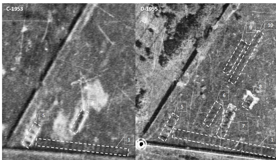
2. Widok kwatery „L” Wojskowego Cmentarza przy ul. Powązkowskiej w Warszawie w 1953 (C-1953) i 1955 r. (D-1955). Oznaczono i opisano wybrane anomalie, aby nie zatrzeć całości obrazu 16 .